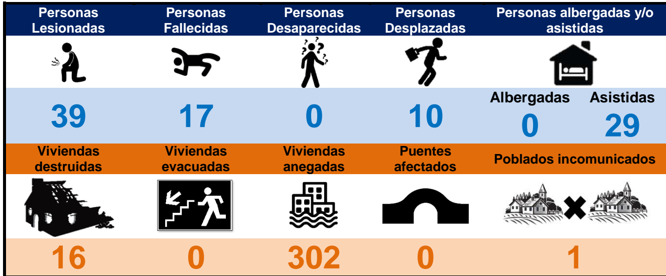
Tabla 2. Resultados mensuales de los sucesos reportados.